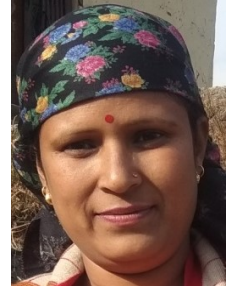
श्रीमति मनमोहणी सदस्य